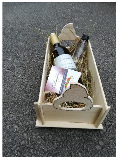
Slika 9: Dopolnjen izdelek.

Kot nadgradnjo bi lahko poleg steklenice hubeljske vode bila tudi steklenica belega vina sorte Sauvignon vinarja Valterja Brataševca. Zraven bi seveda bila prisotna tudi vizitka lokalnega vinarja, slika 9.