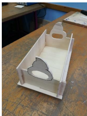
Slika 2: Naš narejen izdelek.