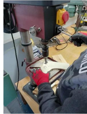
Slika 8: Vrtanje z vrtalnim strojem.