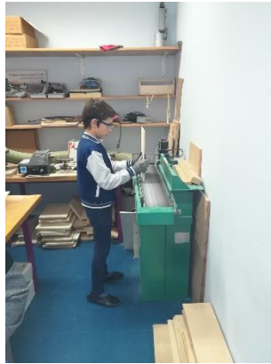
Slika 7: Brušenje na brusilnem stroju.