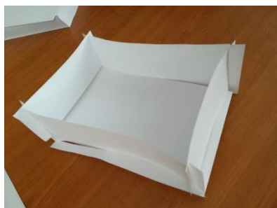
Slika 4: Prototip zaboja.

Žal smo pri izdelavi zaboja sodelovali samo štirje. David je namreč med izdelovanjem zbolel. Najprej smo naredili prototip zaboja iz papirja. Nato smo mere previdno zarisali na leseno površino, slika 4, 5.