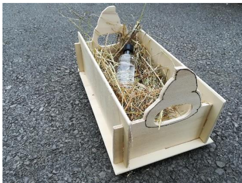
Slika 3: Naš dokončni izdelek.

Seveda naš zaboj ni prazen. Najprej smo dobili idejo, da bi v zaboju bilo vino lokalnega vinarja ter steklenička hubeljske vode. Ampak se nam po dolgem premisleku ni zdelo primerno, saj smo učenci osnovne šole, kamor alkohol ne sodi. Za podlago smo uporabili seno, v zaboju pa je samo steklenica hubeljske vode, ki nam da moč, tako kot velikanu, slika 3.